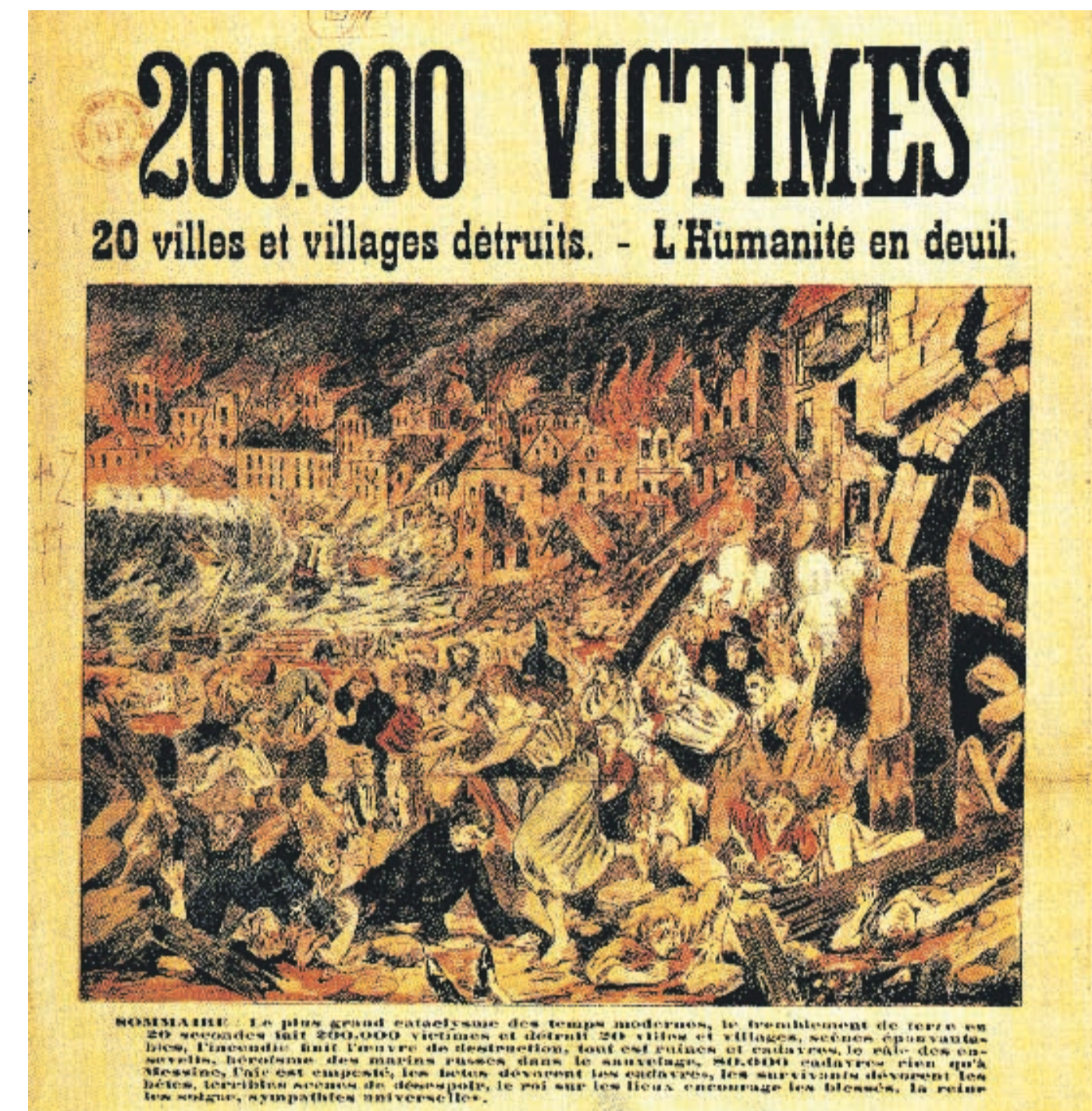
ZEMĚ SE OTŘÁSILA Obětí zemětřesení v Mesině bylo opřibližně sto tisíc. Některé novinové titulky z té doby oznamovaly dokonce 200 tisíc mrtvých.

Italské úřady byly nuceny sáhnout k evakuaci obyvatelstva a přesunout nadlouho tisíce lidí do náhradních domovů. Asi 850 z těch, kteří přežili, se rozhodlo emigrovat do Spojených