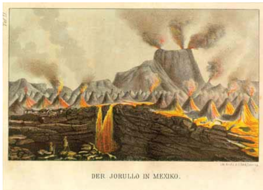
4/ Vznik a erupce sopky Jorullo v západním Mexiku v r. 1759. Barevná litografie - ilustrace odvozená od náčrtu A. von Humboldta (z přelomu 18./19. století), vydaná J. G. Bachem v Lipsku ve 30. letech 19. století. Soukromá sbírka.

Historické záznamy a nákresy vulkanických erupcí poskytují dnešním vulkanologům neocenitelné údaje o časovém vývoji a morfologii samotných vulkánů, umožňují mapovat stará lávová pole a nesou i údaje o jejich stratigrafii. Často jde o unikátní záznamy, protože mladší erupce obvykle překrývají starší lávová pole. Některá zobrazení následků erupcí umožňují učinit si představu i o škodách v sídlištích zasažených lávovými splazy.