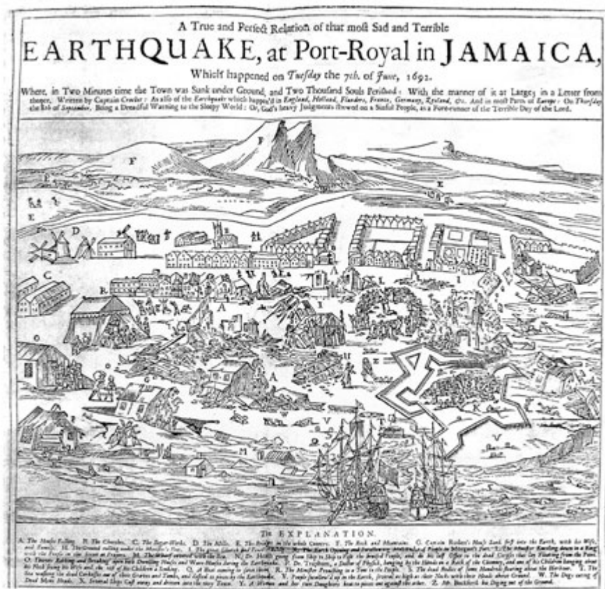
1/ Zemětřesení v Port-Royal na Jamajce dne 7. června 1692. Mědirytina ilustruje letákový list o události vydaný téhož roku v Londýně. ([1] č. kz545)

Tak kupř. městem samotným je možno vést ostrou linii, která odděluje navzájem zcela zničenou přístavní centrální část města od jeho okrajových čtvrtí, které jsou vykresleny jako nepoškozené. Zdá se tedy, že hlavní škody (podle kterých byly provedeny odhady intenzity) nevznikly městu následkem seismických otřesů, ale propadem/sesuvem přístavní části města do moře. Předpokládáme, že již dříve byly písčité podložní vrstvy této části města zvodněny (liquifaction), čímž byla oslabena jejich stabilita – seismické otřesy tedy jen spustily již připravený sesuv. I když se výše zmínění autoři intenzitního odhadu vyšetřovaného zemětřesení o sesuvu části Port Royal do moře zmiňují [3, 4], nedocenili zřejmě dopad tohoto jevu na velikost I_0 . Podle nejnovější interpretace obrazového materiálu, jejíž základní předpoklady zde byly naznačeny, mohli tak autoři práce [5] radikálně snížit hodnotu I_0 o celé tři intenzitní stupně na úroveň I_0 = VII a pozměnit tak seismicitní mapu oblasti.