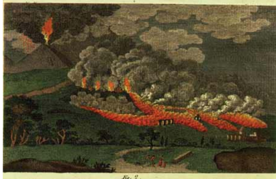
3/ Erupce Vesuvu v r. 1783. Ručně kolorované mědirytiny - ilustrace