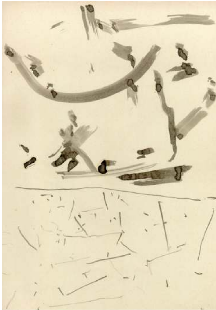
Petr Veselý: z cyklu Záznaky 1987-8, tuž, papír 29.7 x 21 cm

Jeden z archetypálních tvarů tupouhý trojúhelník spatřil na mnoha místech. Jako kus utrženého papíru, coby průhled mezi překříženými pažemi cestujících v ranní tramvaji, ve tvaru oblaku, v díře do mraků, v nalezeném střepu, v posledním ostrůvku tajícího sněhu, v otvoru ve štítě stodoly.