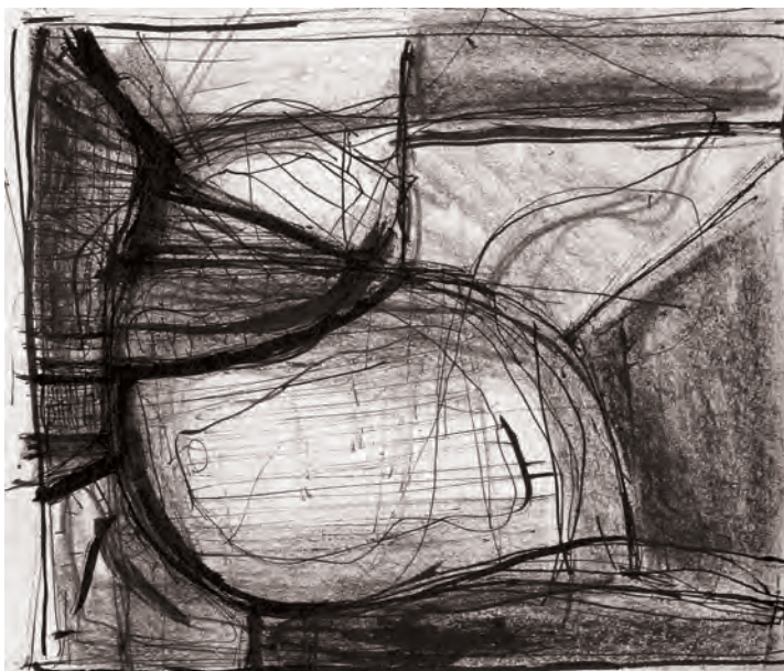
Jaroslav Rezek - Kompozice II, 70-tá léta, kresba tuší na papíře, 305 x 215 mm

Rezek není ani introvert hloubající nad zákoutími vlastní duše, ani extrovert ženoucí se za zážitky a dojemovými senzacemi. Promýšlí a procitňuje několik základních pravd: o barvě, přírodě, struktuře, člověku, ale činí tak s důkladností až kubištovskou. Kdybych si jej měl nějak historicky zařadit, musel bych myslet na jedné straně na Purkyně a na druhé na Poliakovu. Jeho koncepce se zrodila, jak se zdá, naráz. Po