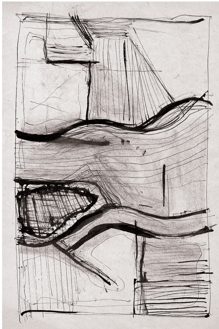
Jaroslav Rezek - Kompozice I, 70-tá léta, kresba tuší na papíře, 297 x 210 mm

Luděk Novák: Z ateliéru Jaroslava Rezka, Výtvarné umění 1969 (19), č. 4, s.196-197