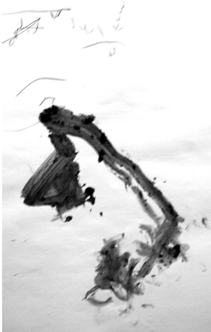
Miloš Šejn: Javořím potokem, srpen 2009, kombinovaná technika, papír, 100 x 70 cm (výřez)

otevřít se hlubokému pohledu kamenů, skal, roklí a oknům trhlin, jež v nás vyvolávají vzpomínky majíc tvary koní pádících zlatem v azuru travin noci. prohlédnout mnohočetnými očima vláken kořenů rostoucích, jak všude kolem nás, my červové hliněných nebes, bílá je na povrchu slunce a nebo žhne v útrobách, v pažích