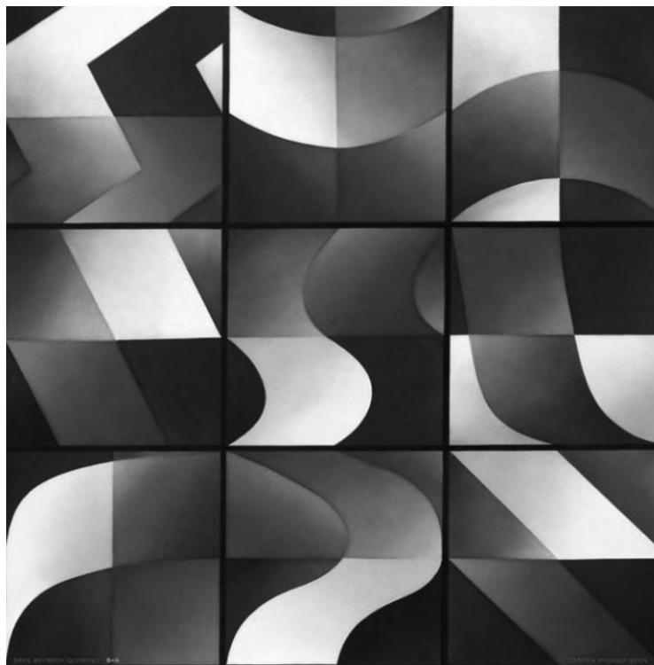
Zdeněk Prokop: Dave Brubeck Quartet, 2004, akryl a nitroemail na plátně, 130 x 130 cm

Ale co je to vlastně prostor? Matematický a geometrický pojem, euklidovský, vybudovaný