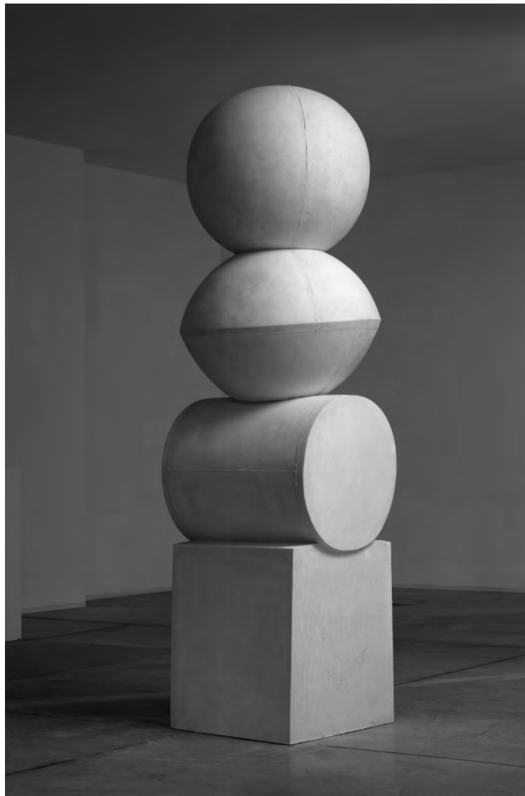
Hrany II 2012, beton, v. 226 cm

- Socha (plastika, objekt) vyjímá či vytrhává svou přítomností část z nekonečného prostoru, přesahuje tak své rozměry, ovlivňuje okolí. Energie, kterou vyzařuje, tvaruje či deformuje pole, ve kterém neviditelné silokřivky doznívají jako ozvěna nebo kola na vodě. Rozpoznat, kde oblast jednoho díla končí a druhého začíná, je záležitostí citu a zkušenosti. Díla se totiž většinou brání bezprostřednímu sousedství, vyžadují svůj vlastní prostor, neblízko - nedaleko.