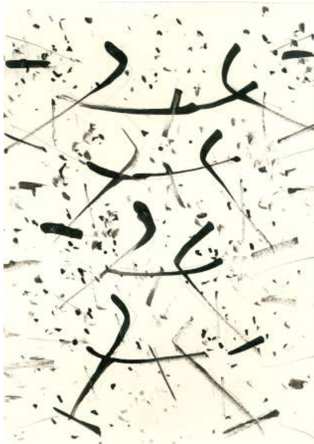
Miroslav Koval: 8/03, 2003, kresba tuší, 163 x 117 mm

Kresby inspirované skutečností jsou i nejsou abstraktní. Často už totiž není možné vysledovat původní inspiraci,