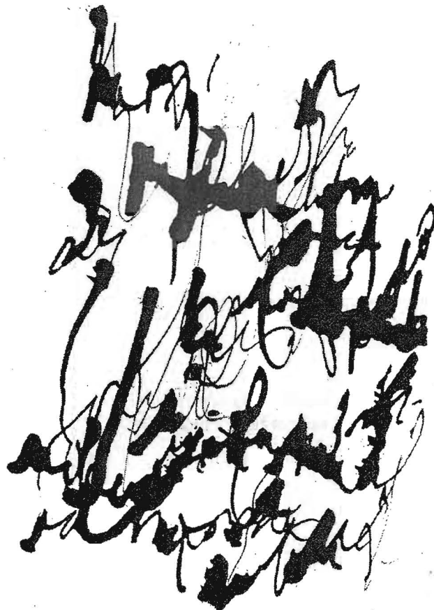
Karel Adamus: Volný verš 2, 1988, kresba tuší, 205 x 149 mm

Adamusovy peripatetické básně mají malé rozměry, většinou totiž vznikají na zvláštní podložce, kterou básník před sebou při chůzi nese, nebo přímo na těle, na několika vybraných energetických centrech - čakrách. Dělí se do skupin podle druhu použitých papírů, kreslířských pomůcek (tužka, pastelky, tuš), zápisů a záznamů (znaky, symboly, slova, citace), podle prvotního záměru (udržet při chůzi umístění výchozích bodů, nakreslit za pohybu základní geometrické obrazce). Konečná podoba je dána nejen autorem tělesností, duševním rozpoložením, rytmem kroků,