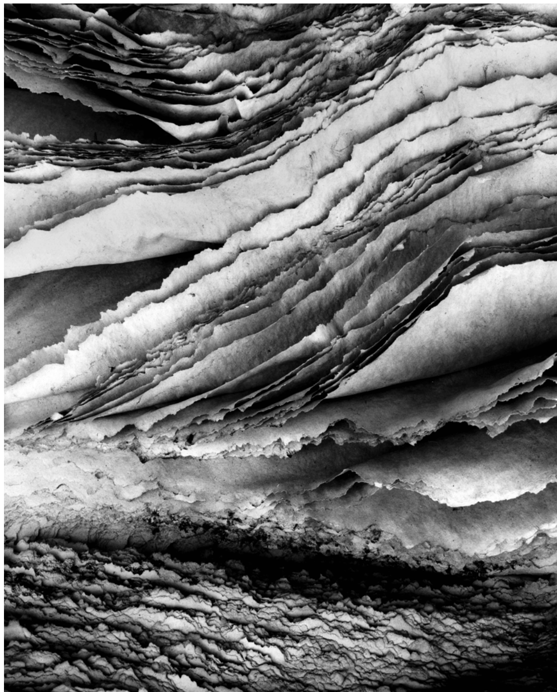
Hana Hamplová, bez názvu, 80. léta, fotografie, 90 x 60 cm