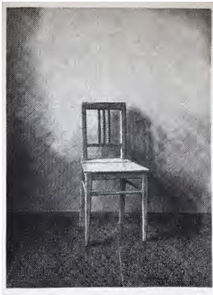
Vojtěch Kovářik: Židle , 2021, linoryt, 81 x 59,5 cm

Metodicky vychází z tradičních, velmi náročných technik sítotisku, linorytu a ručního tisku, jež propojuje a posouvá díky rafinovanému experimentálnímu postupu, využívajícímu polygrafických technologií pro přenos analogového záznamu. Zajímá ho především transformace trojrozměrného prostoru do dvojrozměrné dimenze se záměrně zakomponovanou tiskařskou chybou a současně působení světla. Předlohou k odrývaným matricím jsou mu