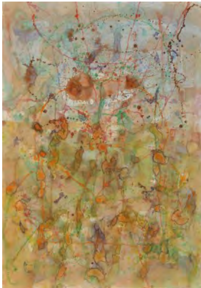
Petr Bareš: bez názvu, 2018, akvarel, 100 x 70 cm

Následné desetiletí - možná i v důsledku charakteru tehdejší doby - proměnilo dobrodružství spojené s destrukcí barevných hmot a s metodou asambláže v požadavek