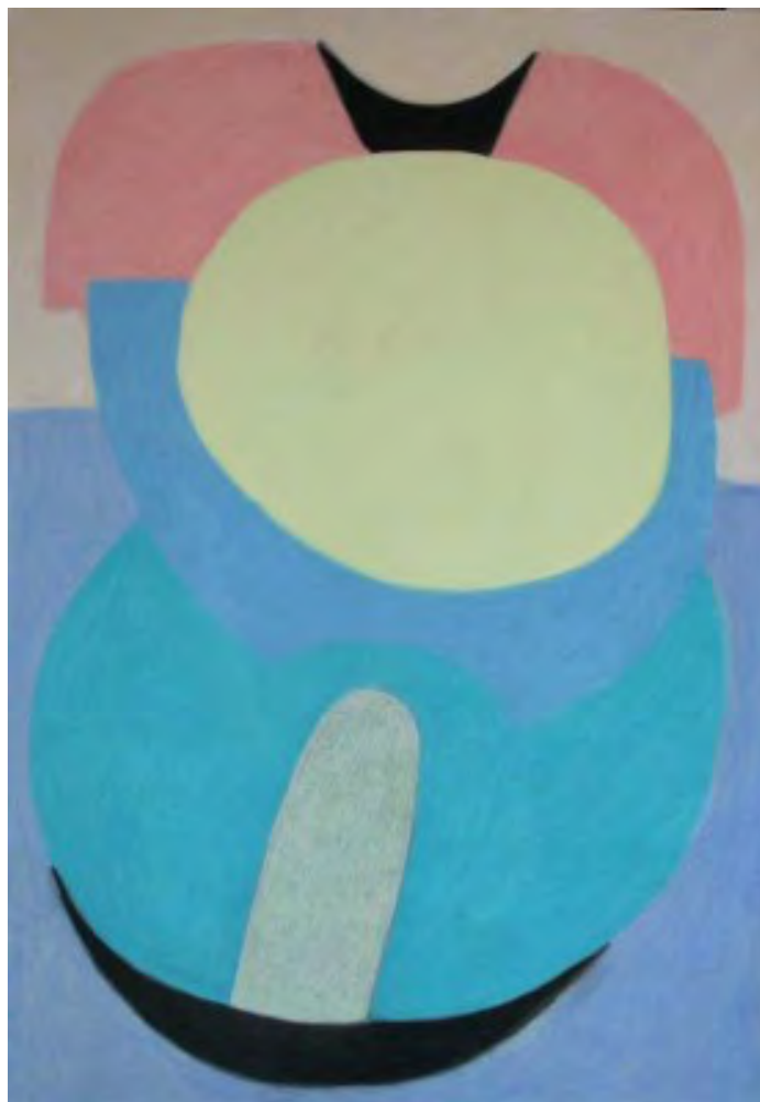
Petr Bareš: Pastel č. 23, 2009, 100 x 70 cm

(In: Technologia Artis 1, 1991; Technologia Artis 3, 1993; Průzkumy památek 2006, roč. III). Samostatně vystavuje od roku 2006.